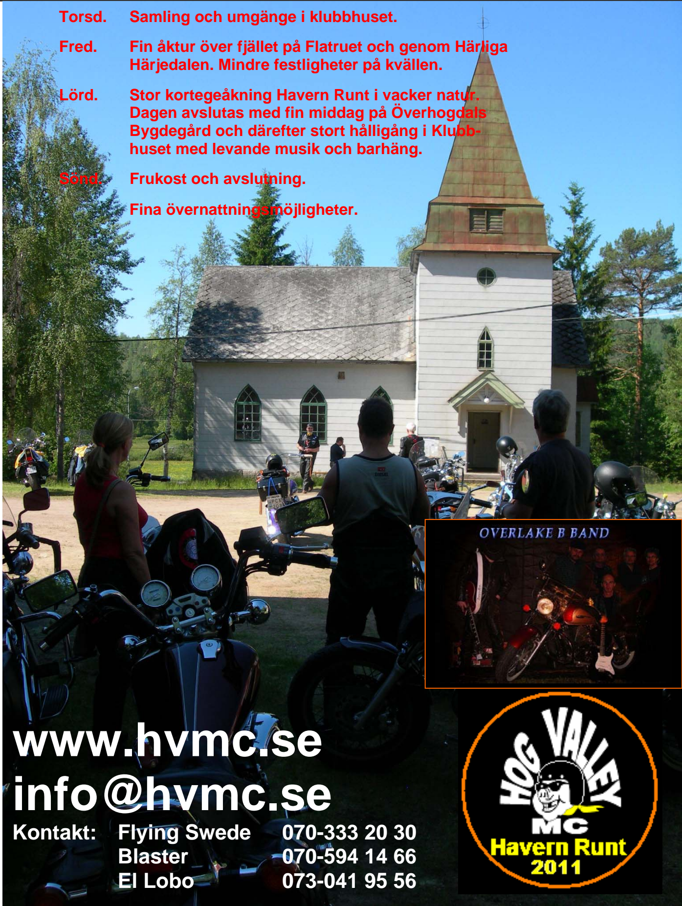
OVERLAKE B BAND